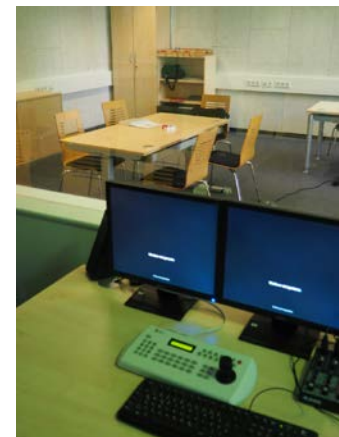
Therapieraum im Ambulatorium

https://www.ifb.uni-wuppertal.de/de/arbeitsbereiche/rehabilitationswissenschaften/trainings-fuer-jugendliche-mit-adhs.html