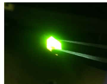
Lichtemittierender Perowskitkristall